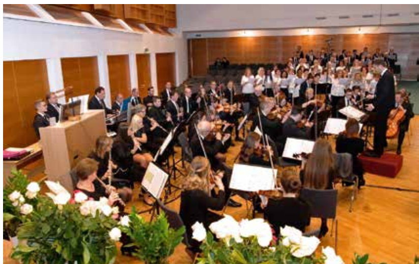
Chor und Orchester im Gottesdienst in Gmunden

Die Gemeinde Interlaken-Matten durfte am Sonntag, 21. Oktober, das 100-jährige Jubiläum feiern.