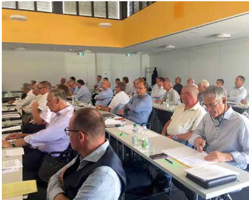
Bezirksämterversammlung im Campus Sursee

Im Toscana Kongresszentrum in Gmunden (Österreich) hatten sich am Sonntag, 30. September 2018, die Glaubensgeschwister aus den Bezirken Linz und Salzburg versammelt. Bezirksapostel Jürg Zbinden diente ihnen mit einem Bibelwort aus Lukas 13, 29: «Und es werden kommen von Osten und von Westen, von Norden und von Süden, die zu Tisch sitzen werden im Reich