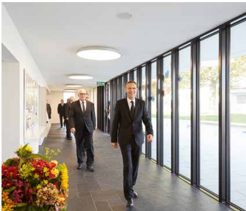
Der Korridor der neuen Kirche in Murten

Der Apostel erzählte, wie er am Vortag einen Vater beobachtete, der mit seinem Sohn ein Spielhaus baute und wie sich das Kind über die Entstehung des Hauses freute. Er bat die Gemeinde, dieses Bild der Entwicklung, der Freude am Fortschritt, mitzunehmen. So soll es ebenfalls mit dem Tempel in uns geschehen. Der Glaube an die Wiederkunft Christi soll uns das Wichtigste sein.