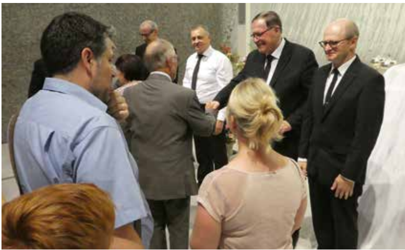
Nach dem Gottesdienst verabschiedet sich der Bezirksapostel von den Glaubensgeschwistern

Begleitung von Apostel Vasile Cone In Solothurn-Zuchwil den Glaubensgeschwistern der Gemeinden Solothurn-Zuchwil und Herzogenbuchsee.