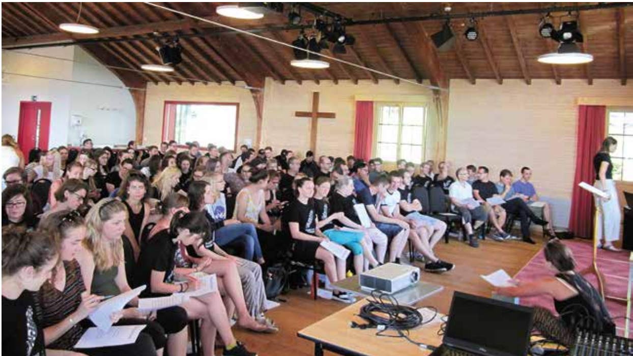
Chorprobe im Camp Vaumarcus