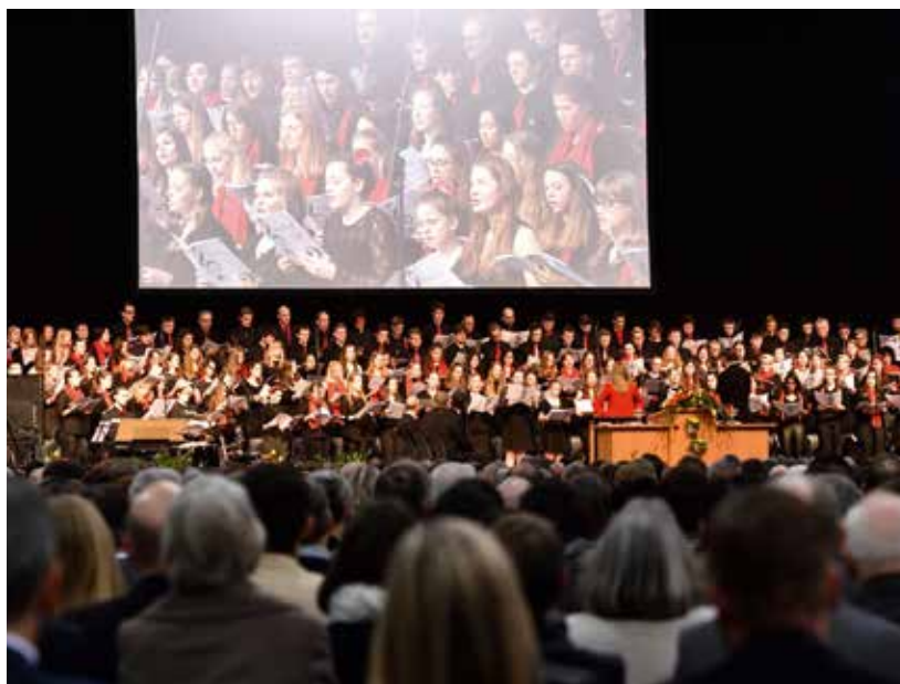
Liedvortrag des Chores Meet ,n' Sing