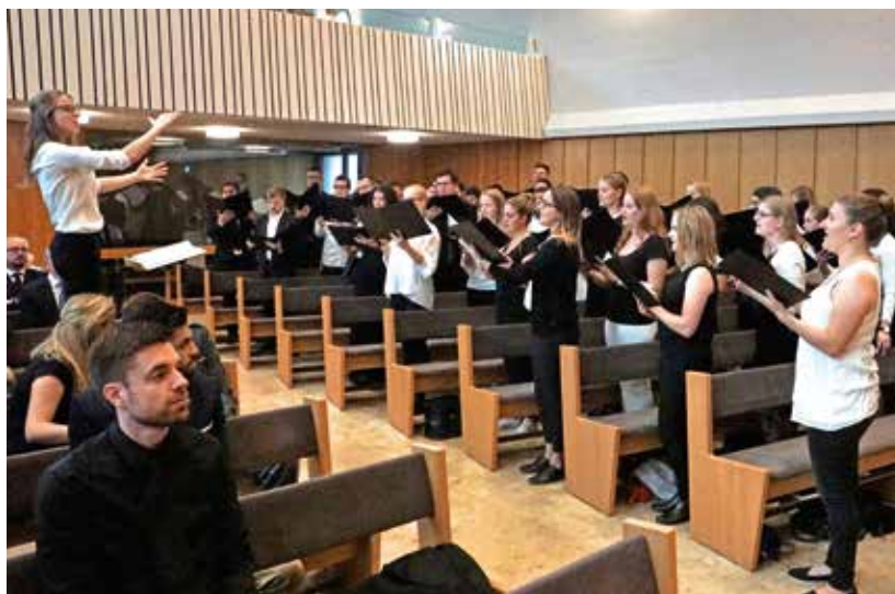
Der Jugendchor im Jugendgottesdienst in Uster

Im Campus Sursee begrüßte Bezirksapostel Jürg Zbinden am Samstag, 8. September 2018, die Bezirksämter aus den fünfzehn Kirchenbezirken der Gebietskirche Schweiz. In seinen einleitenden Gedanken sagte er: «Es soll sich etwas bewegen! Dazu sind wir vom Herrn berufen und befähigt worden. Ich wünsche mir, dass unsere heutige Zusammenkunft nicht nur Impulse mit spontanen «Aha»-Erlebnissen hervorbringt, sondern neue Erkenntnisse und Einsichten, die sich nachhaltig auf unser Dienen an den Seelen der Anvertrauten auswirken.» Amtsverständnis und Kirchenstrategie bildeten die Schwerpunktthemen der dies-