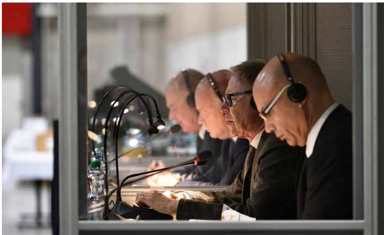
Simultanübersetzung in mehrere Sprachen durch ehrenamtliche Übersetzer im Ämtergottesdienst vom 11. März 2018 in Luzern