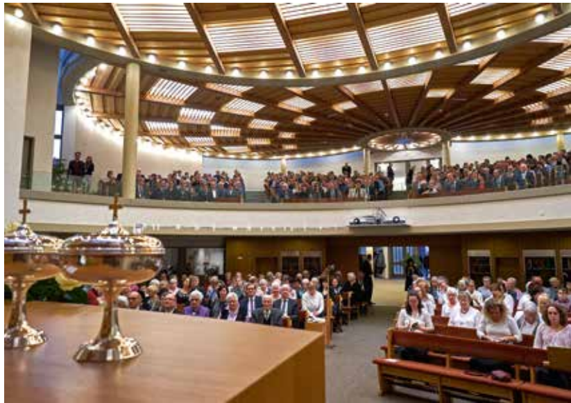
Der Kirchensaal in Bern-Ostermundigen