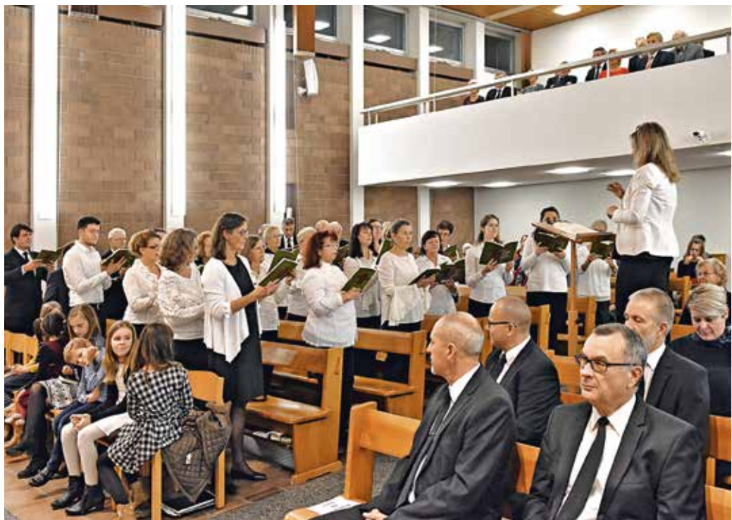
Liedvortrag des Chores während des Bezirksapostelgot- tesdienstes vom 6. Dezember 2018 in Bern-Bümpliz

Es sind keine Ereignisse nach dem Bilanzstichtag bekannt, welche einen Einfluss auf die Jahresrechnung 2018 haben.