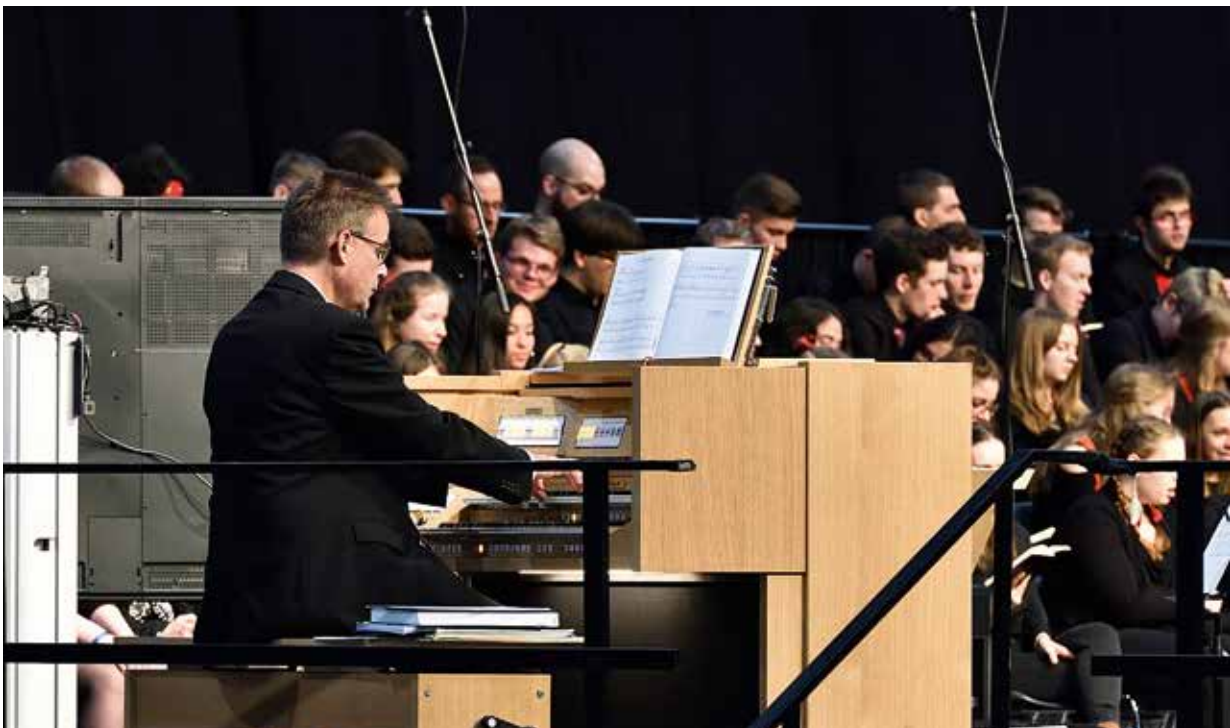
Organist am gesamtschweizerischen Ämtergottesdienst vom 11. März 2018 in Luzern