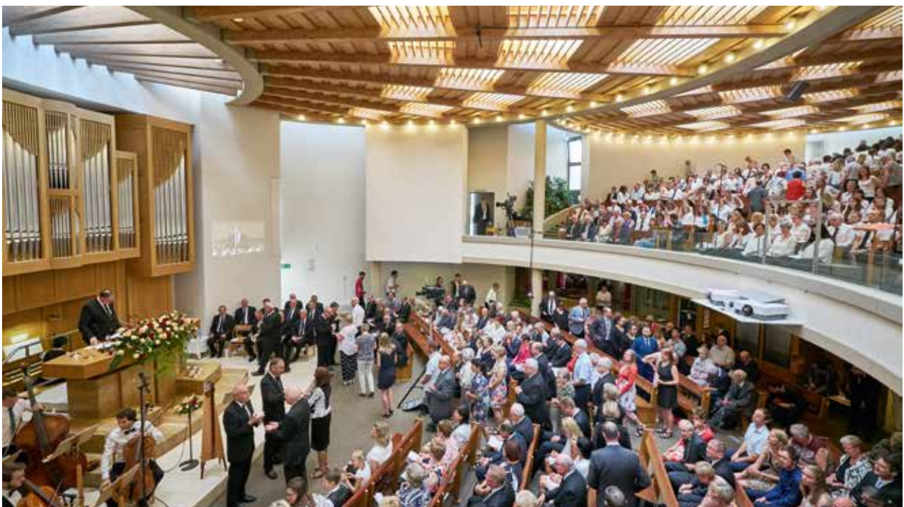
Die Festgemeinde in Bern-Ostermundigen

«Es gibt viele Gemeinden, wo ich mich für meinen letzten Gottesdienst hätte einschreiben können. So richtig bewusst wurde mir erst vor einigen Tagen, welche besondere Beziehung mich mit eurer