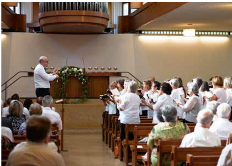
Liedvortrag des gemischten Chores

«Was soll ich dir tun?». Diese Frage findet sich in der Geschichte vom Öl der armen Witwe (2. Könige 4, 2) und diente Bezirksapostel Jürg Zbinden als Grundlage für den Sonntagsgottesdienst am 12. August 2018 in Basel. Die Glaubensgeschwister der Gemeinden Allschwil, Oberwil, Reinach, Stein waren zu diesem Gottesdienst mit eingeladen, in dem der Bezirksapostel vier Erwachsenen und sechs Kindern das Sakrament der Heiligen Versiegelung spendete. Musikalisch wurde der Gottesdienst sehr würdevoll vom Basler Projektchor, dem Organisten und einem Instrumental-Ensemble umrahmt.