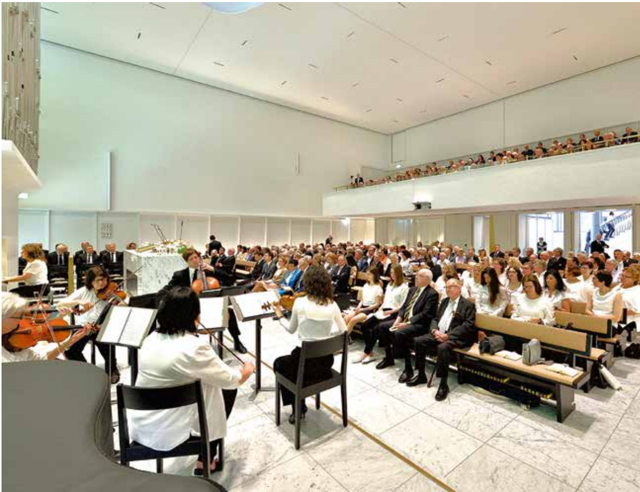
Orchester im Gottesdienst vom 6. Mai 2018 in Zürich-Albisrieden