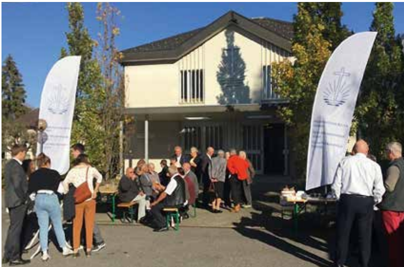
Jubiläum – die neuapostolische Kirche in Matten-Interlaken