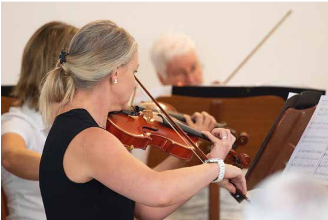
Instrumentalensemble im Gottesdienst vom 12. August 2018 in Basel