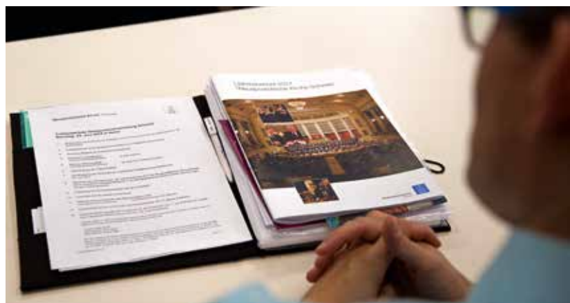
Unterlagen der Delegiertenversammlung